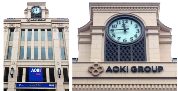
<株式会社AOKIホールディングス・株式会社AOKI 新社屋に新ロゴを掲出>

AOKIホールディングスを親会社として、傘下にファッション事業の株式会社AOKI、アニヴェルセル・ブライダル事業のアニヴェルセル株式会社、エンターテイメント事業の株式会社ヴァリックを持つAOKIグループは、「社会性の追求、公益性の追求、公共性の追求」の3つの経営理念を掲げ、企業活動を推進しています。