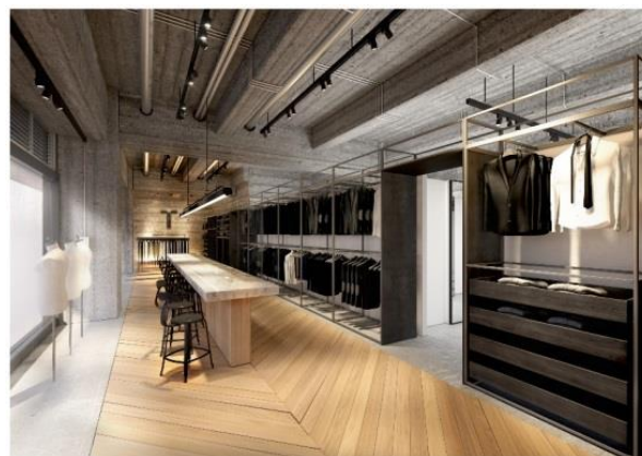
Aoki Tokyo 銀座6丁目店

近年都市部で増えているオーダースーツのニーズに対応するべく、2016年より既存店にてオーダー事業を開始したA O K Iにとって、今回の「Aoki Tokyo」は、初のオーダー単独新ブランドの立ち上げとなります。「Aoki Tokyo」では、オーダーのスペシャリティストアとして大都市圏のビジネス街や主要ターミナル駅近くの立地に出店することで、既存事業ではリーチしきれない20代～40代のお客様に対して新しい購買体験をご提供します。